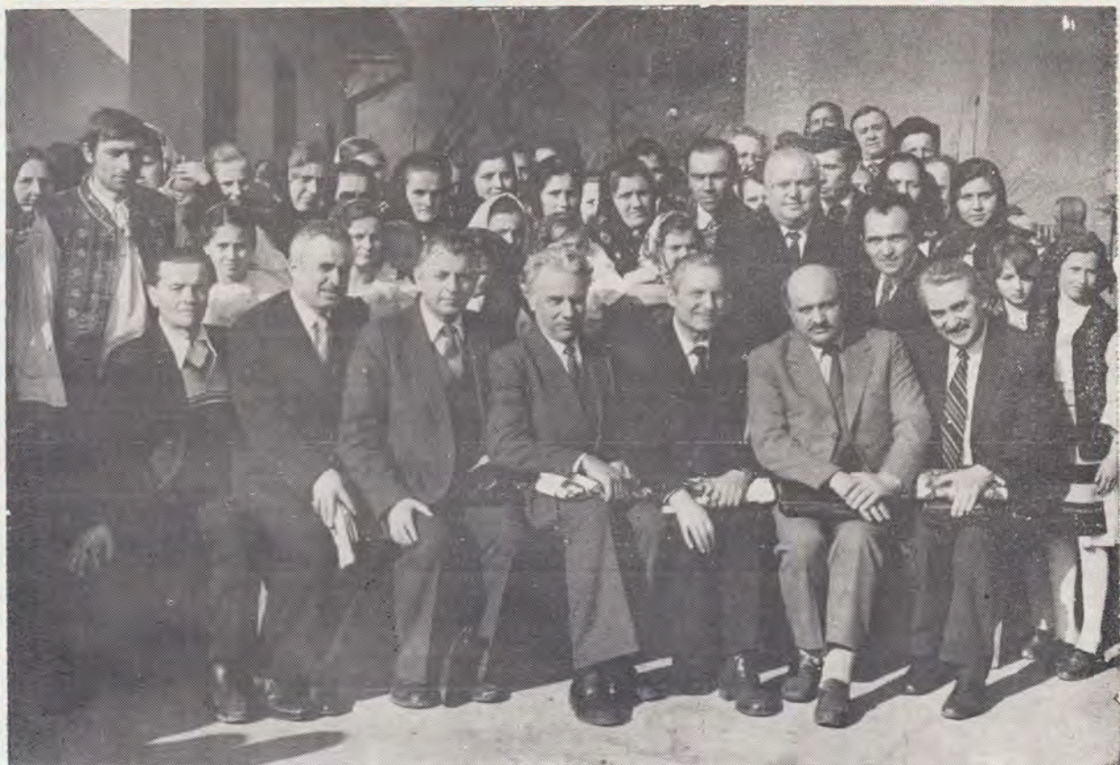
Oaspeții în mijlocul comunității Repedea, jud. Maramureș

putut întreține cu frați în limba ucraineană și să predice în această limbă. Și-au exprimat satisfacția văzînd că naționalitățile conlocuitoare din România, își păstrează limba, portul, au școli în limba lor, bucurîndu-se de depline libertăți de manifestare.