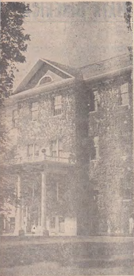
Clădirea principală a Colegiului A.Z.S. Wala-Wala în care se află administrația și direcția.