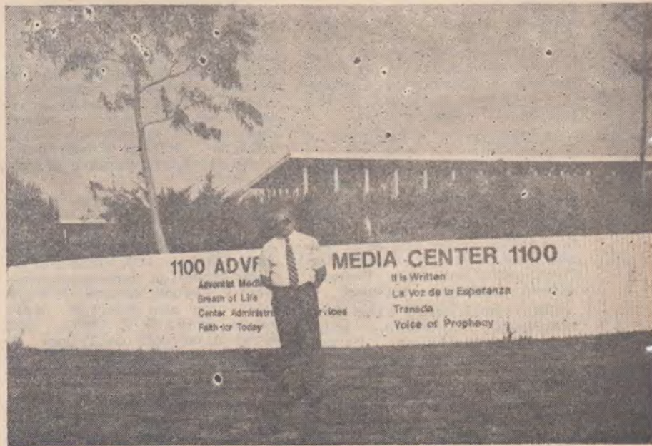
În fața sediului studiourilor de radio și televiziune ale programului „The Voice of Prophecy”

Wala Wala College este situat în partea de sud-est a statului Washington, Walla Walla fiind o denumire indiană care înseamnă „multe ape”, sau o curgere de apă mică dar repede. Vechiul nume al orașului era Stepteville, numele actual i-a fost dat la 7 noiembrie 1959. Wala Wala College a fost înființat de către Biserica A.Z.S. în 1892. În prezent, în anul școlar