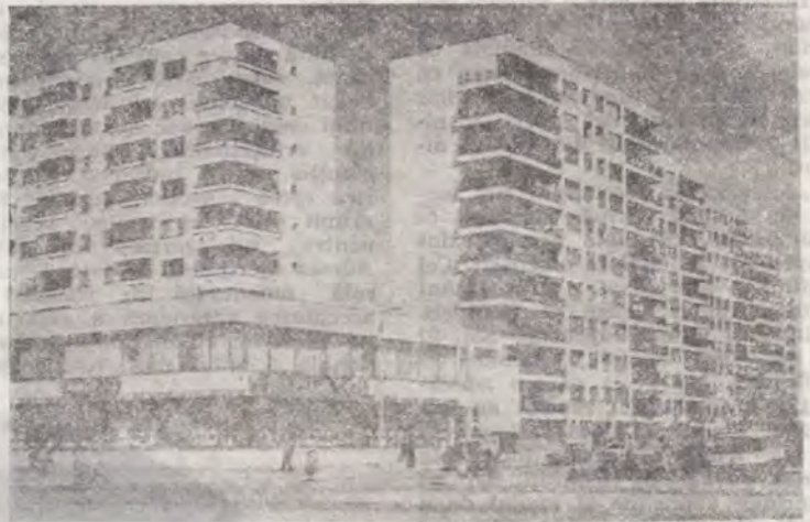
Slobozia — un oraș demn de renumele oamenilor care l-au ridicat

Credincioșii Adventiști de Ziua a Șaptea consideră că toate năzuințele legitime spre libertate, in-