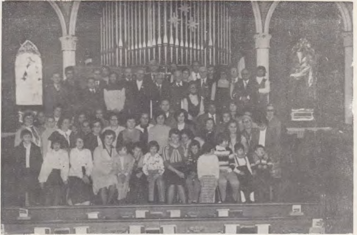
Membrii Comunității A.Z.S. din New York cu familiile lor