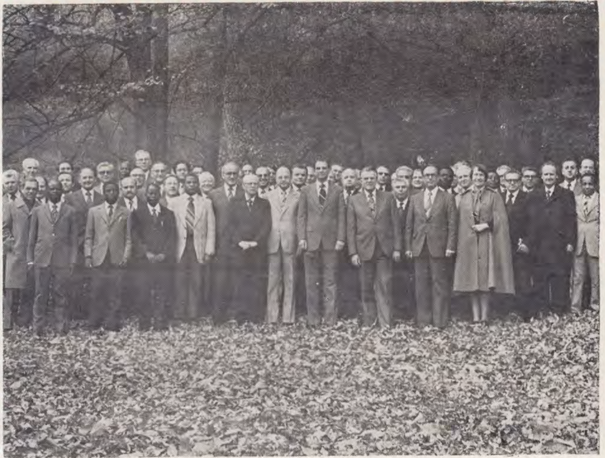
Grupul participanților la ședința Comitetului Diviziunii Euro-Africa ținută la Berna între 7—16 noiembrie 1978 (vezi pag. 16)

Explicațiile lor sînt de fapt de natură diferită, și care derivă din surse divergente. Învierea Domnului în sine este numai timid menționată. Noi nu putem deci în mod legitim să determinăm însemnătatea expresiei „Ziua Domnului” sprijinindu-ne pe explicațiile și pe folosirea ei de mai tîrziu. Acest fapt este în mod deosebit adevărat, așa cum vom vedea în lumina schimbărilor ce au avut loc în prima parte a secolului al doilea în reevaluarea creștină a iudaismului și păzirea religioasă a acestuia.