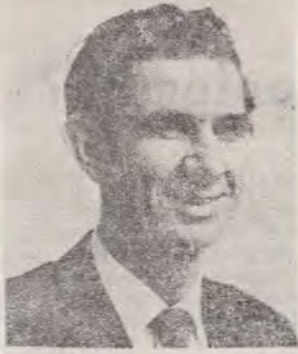
NEAL C. WILSON

Noul Președinte al Conferinței Generale A.Z.S.