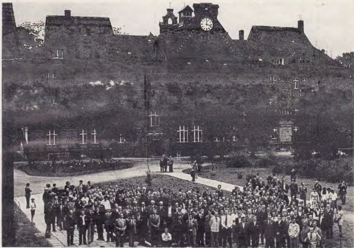
Participanții la Conferința Biblică de la Friedensau — R. D. G. 18—16 iulie 1977)

În zilele de 8-17 iulie 1977 a avut loc la Friedensau în R.D.G. o Conferință Biblică la care au participat 297 de pastori din mai multe țări din Europa. Friedensau se află la 150 km depărtare de Berlin. Aici se află unul din cele mai vechi Seminarii Teologice din Europa. Seminarul, căminul de bătrâni, casa de odihnă și alte anexe alcătuiesc o comună cu circa 350 de persoane, având propria ei administrare. În acest loc s-a ținut Conferința amintită.