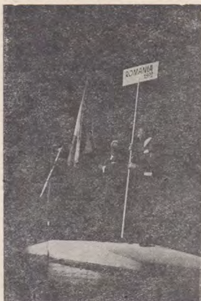
Mesagerii bisericii noastre.

a cărui dragoste pentru noi nu s-a schimbat niciodată și ca să lăudăm pe Mielul lui Dumnezeu, care ne-a împăcat pe noi păcătoșii, cu iubitorul nostru Tată ceresc, prin singele Său, vărsat fără plată pe crucea de pe Golgota, și în rugăciune, pentru ca Duhul Sfânt să aducă prezența și puterea Tatălui și a Fiului în adâncurile inimilor și gândurilor din templele trupului Său.