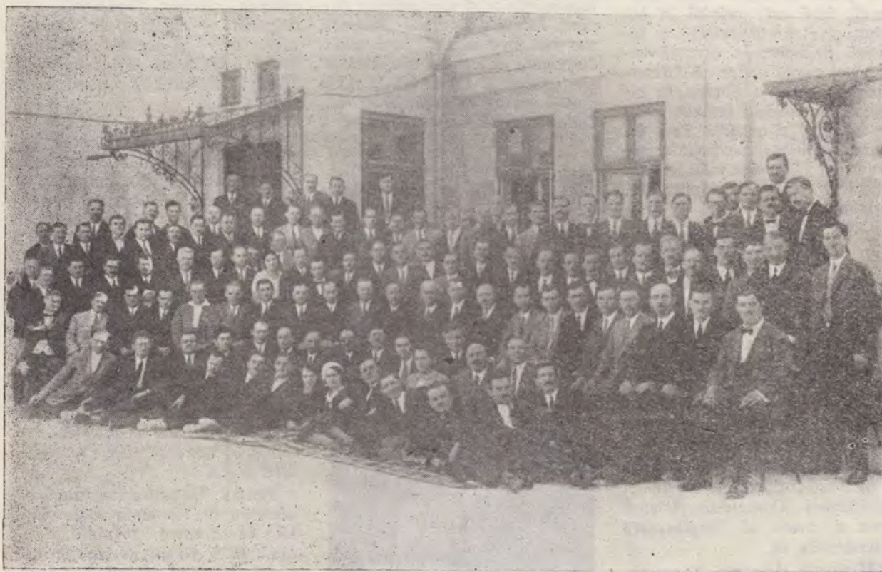
Adunarea Generală a Uniunii din 1932

3. Epoca cuprinsă între 1936-1955 se desfășoară pe fundalul unor evenimente sociale și politice cu largi rezonanțe și semnificații. Este epoca fascismului și a nimicirii lui, care ajunsese să transforme o parte a Europei în