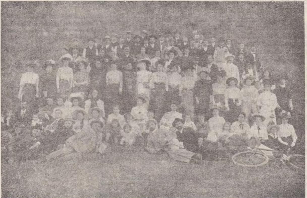
Comunitatea A.Z.S. București — Dr. Felix București 1909