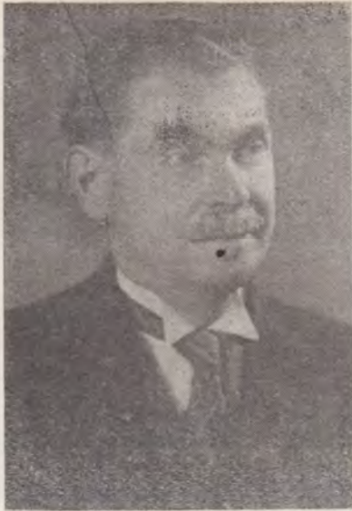
P. P. Paulini 1882—1953

caldă, un plus de energie ce cuprinde întreaga noastră ființă.