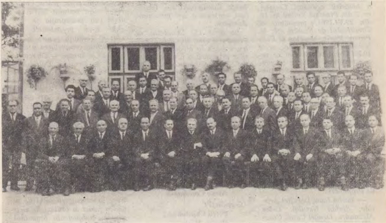
Participanții la Adunarea Generală a Uniunii- București, 9 iulie 1967

La orele 10,20 Adunarea Generală alege din sinul ei, pe Conferințe, următorul Comitet special, care este votat în unanimitate: