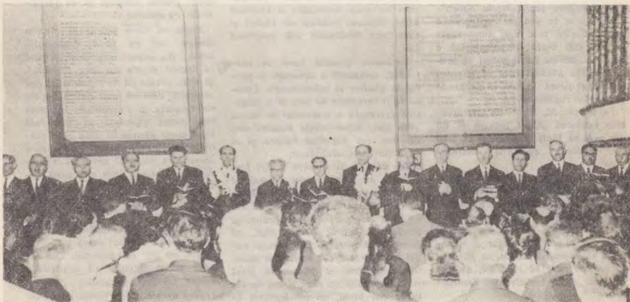
Sîmbătă 8 iulie 1967 — Comunitatea Labirint