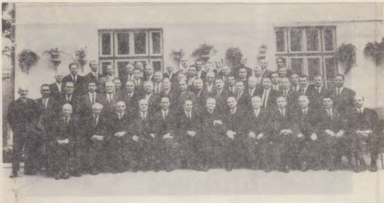
Delegații la Adunarea Generală Electivă a Uniunii

Sintem noi, iubiți frați delegați, ceea ce așteaptă Dumnezeu să fim?