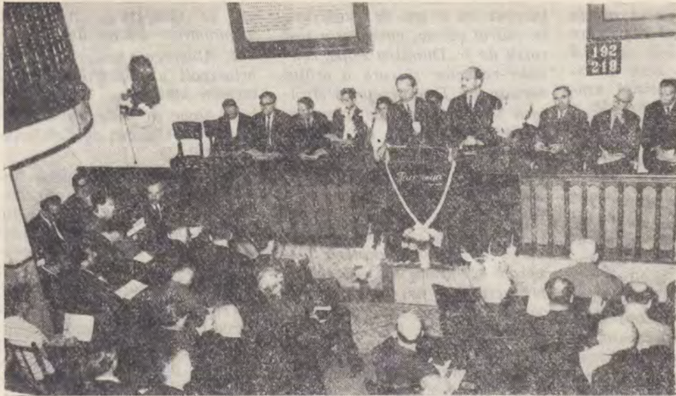
In Comunitatea Labirint 8 iulie 1967