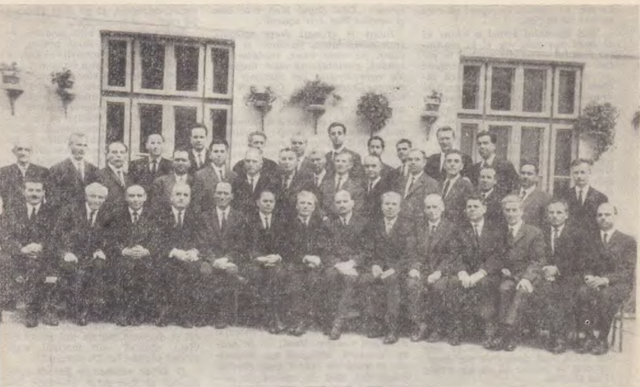
Comitetele de Conducere ale Conferințelor, Comitetul Uniunii, și Directorul Casei de Pensii

nic, a se preda Domnului Său. El trebuie să cerceteze în cuvîntul lui Dumnezeu, să învețe a pătrunde însemnătatea Sa și să asculte de învățăturile Sale. În felul acesta el poate ajunge înaltul ideal al desăvirșirii creștine. Zi după zi lucrează Domnul cu dînsul și desăvirșește caracterul, care va trebui să reziste timpului ultimei probe. Zilnic aduce cel credincios, înaintea oamenilor și a îngerilor, dovada sublimă despre ceea ce poate face Evanghelia pentru fiii oamenilor“.