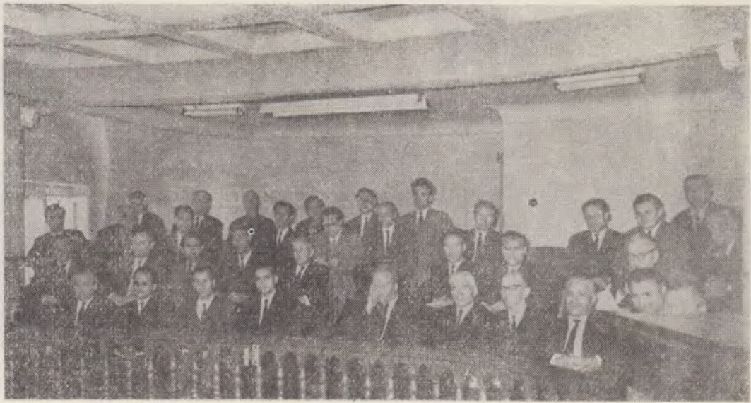
Grupul invitaților și al delegaților supleanți