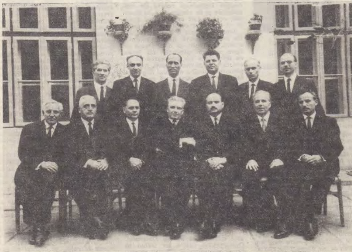
Comitetul Uniunii de Conferințe A.Z.S. împreună cu Directorul Casei de Pensii și Ajutoare a Cultului

Adresăm rugăciuni fierbinți către Atotputernicul Dumnezeu, și Îl implorăm să binecuvinteze cu un succes deplin munca asiduă a poporului nostru, să dăruiască sănătate și puteri de muncă distinșilor conducători ai poporului și să hărăzească prosperitate neîntreruptă scumpei