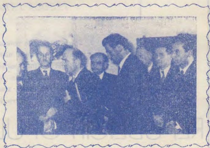
- BIRLAD, 13 OCTOMBRIE 1962 -