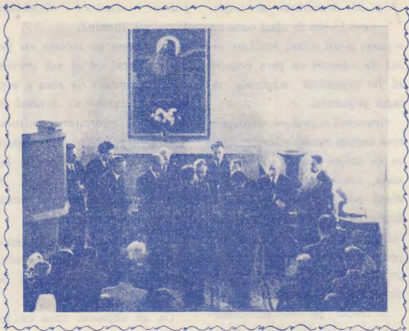
- PLOIEȘTI, 3 NOIEMBRIE 1962 -