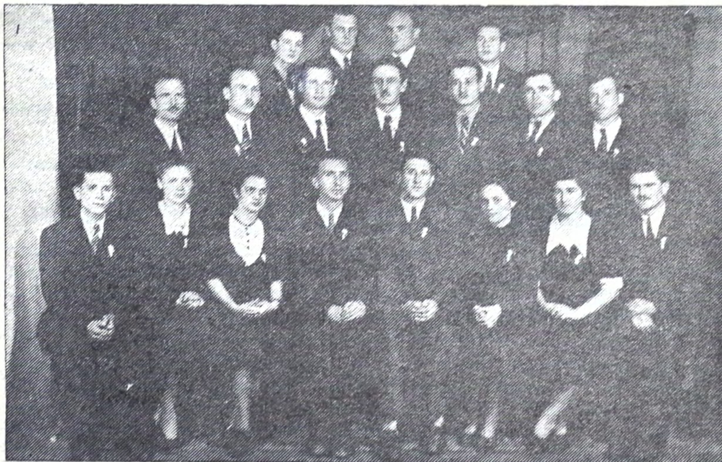
Absolvenții Institutului Biblic Brașov-Stupini, promoția 1948