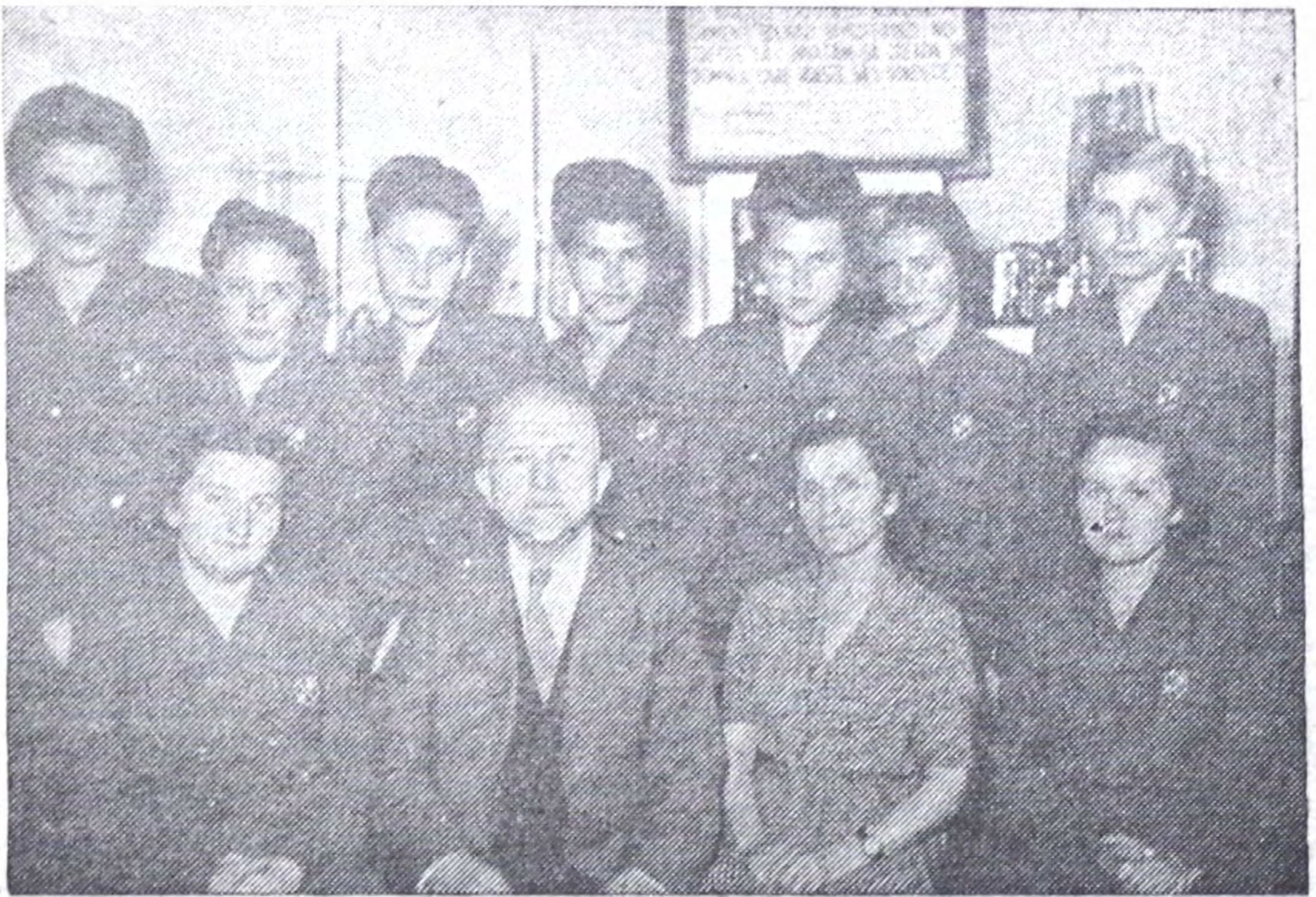
Absolventele Școlii de Infirmerie „Victoria” din București, promoția 1948.