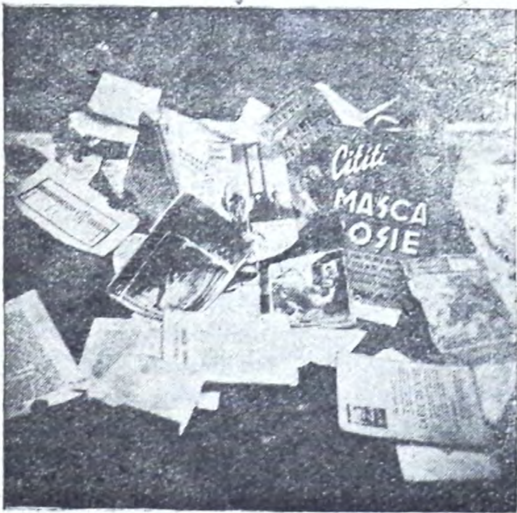
Curățirea bibliotecii de toată literatura ușoară — otravă a sufletului —, s'a făcut.

„Iubiții mei prieteni tineri, cercetați însăși experiența voastră cu privire la influența romanelor captivante. Puteți voi, după o asemenea lectură, să deschideți BIBLIA și să citiți cu interes cuvintele vieții? Nu găsiți voi Cartea lui Dumnezeu lipsită de însemnătate?”