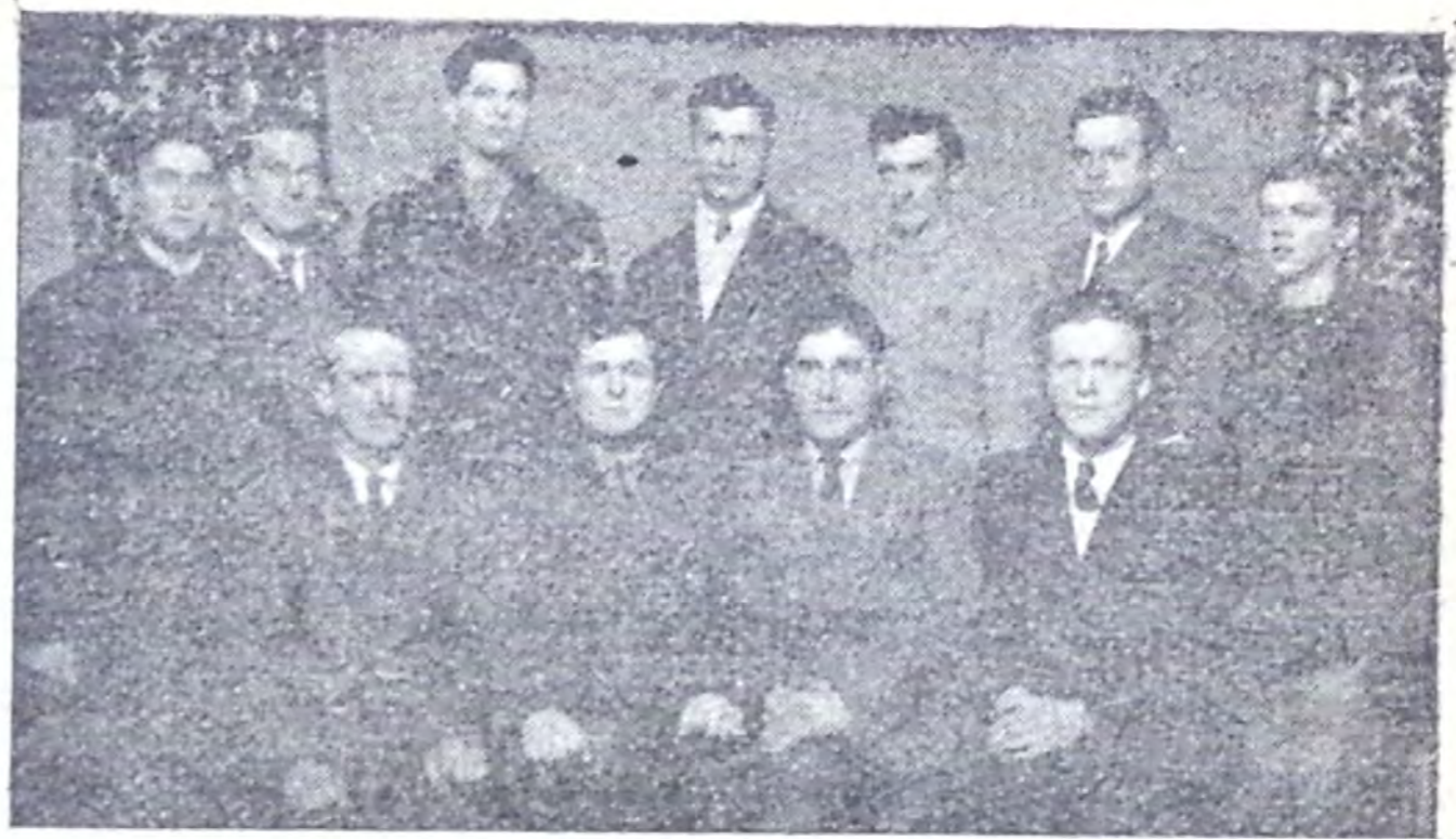
Colportori în Dâmbovița

Am găsit suflete cari au plâns și s'au rugat mulțumind lui Dumnezeu, pentru că a sosit timpul, când să poată vedea lumina