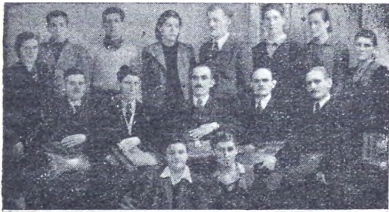
Colportorii din Moldova de Nord

dăruit un foarte frumos succes în distribuirea de tractate.