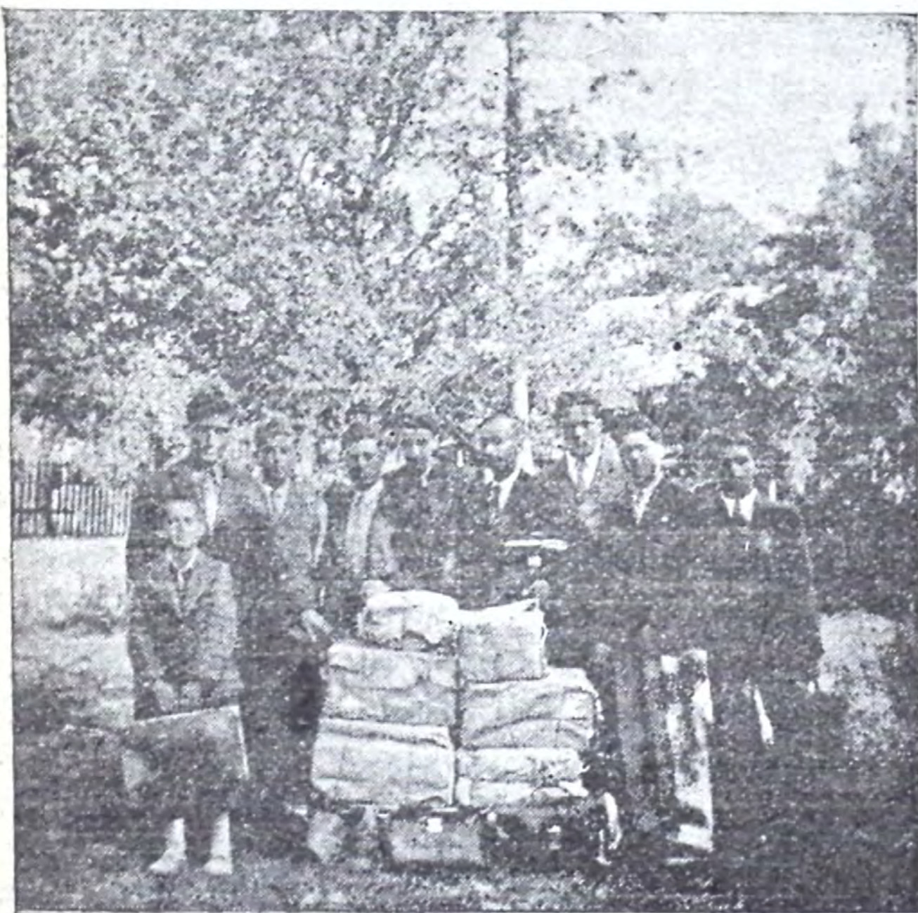
Colportori în Teleorman

„În viziuni de noapte au trecut prin fața mea scene ale marii mișcări de reformă în sânul poporului lui Dumnezeu. Mulți laudau pe Dumnezeu. Bolnavi erau vindecați și alte minuni se săvârșeau. Un spirit de rugăciune se vedea, așa cum a fost înaintea zilei de Rusali. Sute și mii se vedeau vizitând familii și deschizând înaintea lor Cuvântul lui Dumnezeu. Inimi erau convinse prin puterea sfântului Spirit și se da pe față un Spirit deosebit de pocăință. În toate părțile se deschideau uși pentru vestirea adevărului. Lumea părea să fie luminată prin puterea cerească. Mari binecuvântări erau primite de adevăratul și umilul popor a lui Dumnezeu. Auzeam voci de mulțumire și de laudă și părea să aibă loc o reformă cum am trăit-o la 1844“. Mărturii, Vol. IX, p. 126.