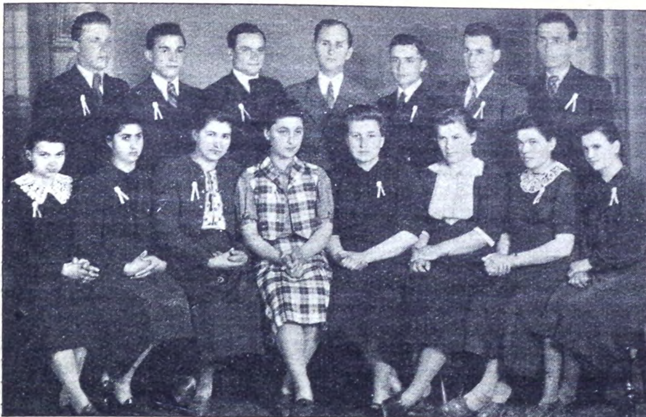
Promoția 11-a a Institutului Biblic — Brașov