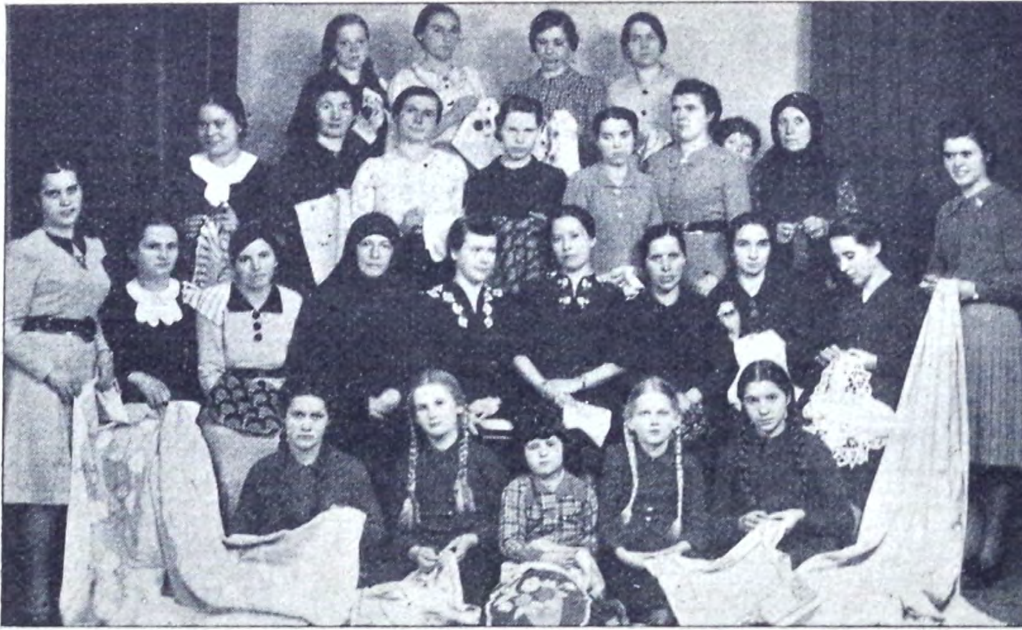
Cercul de binefacere Tabita din Piatra Neamț

Dumnezeu Și-a exprimat hotărârea Sa în aceste cuvinte: „Voiu prăpădi înțelepciunea celor înțelepți, și voiu nimici priceperea celor pricepuți”.