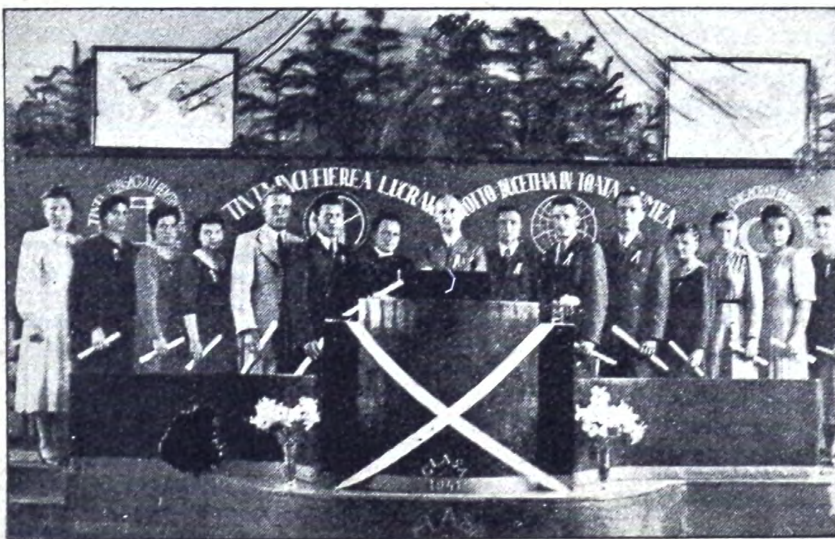
Tinerii absolvenți după primirea diplomelor