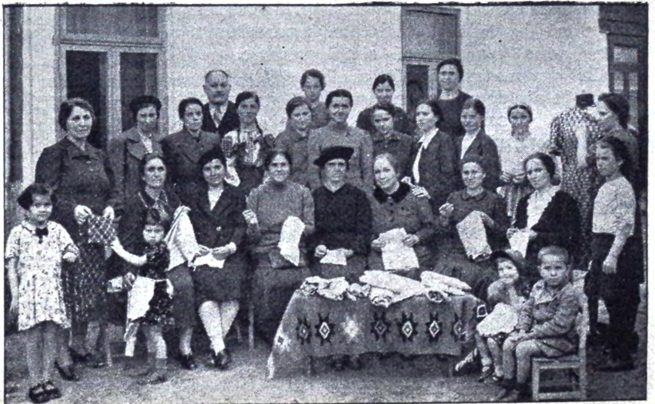
Lucrarea de binefacere a Cercului Tabita din Craiova

Cercul Tabita are nevoie de fonduri pentru a înainta lucrarea; atât pentru nevoile din Comunitate, cât și pentru nevoile urgente din afara Comunității. O strângere generală de daruri pentru lucrarea cercului Tabita, din când în când, va fi de mult ajutor.