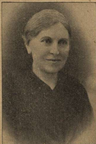
O biruitoare. Pildă pentru multe familii cari se află în aceleași împrejurări.

„După ce mi-a vorbit despre Sabat, eu am și fost foarte doritoare