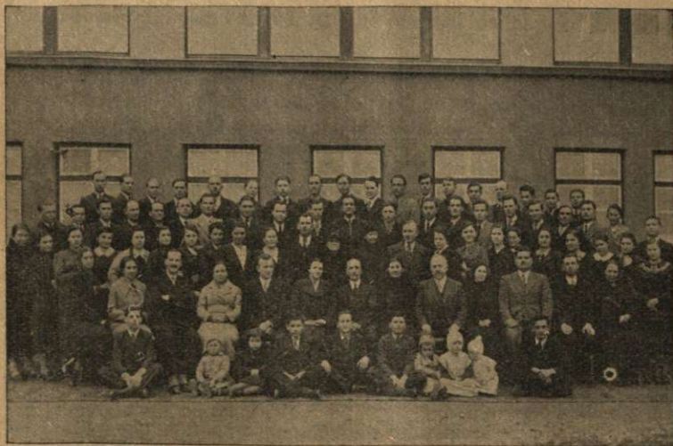
Familia școlară pe anul 1933—39

Procedând prin comparație, simțământul mândriei a determinat pe oameni încă din timpuri foarte îndepărtate, să creadă că — dintre vietățile de pe pământ — ei ar fi mai ceva decât toate. Anumitele daruri cu cari sunt ei înzestrați, — mintea superioară, puțința de a se înălța cu cugetul, spiritul de a-și imagina și de a combina tot felul de construcții din materiale, sau din idei; cât și puțința de a se exprima prin vorbire clară și armonioasă, — toate acestea au făcut pe oameni să-și închipue că ei sunt de un ordin cu mult mai înalt decât animalele și că, în alcătuirea întregii lor ființe, sunt altfel făcuți decât ele. De aceea, din timpuri foarte vechi, s'a spus că omul ar avea altfel de suflet decât animalele, deosebit nu numai prin calitatea, ci și prin durabilitatea lui. Sufletul omului — au zis ei —