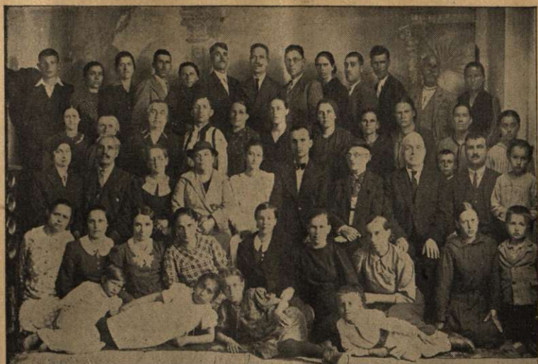
Membrii Comunității din Botoșani.