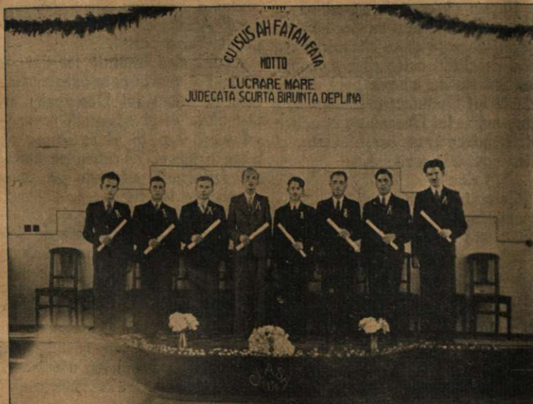
Clasa absolvenților 1937—38.

Oaspeții vin pe rând să-și ocupe locurile hotărâte. . . . . La ora anunțată, în cadența unui marș cântat la pian de fratele D. Dragomirescu, absolvenții își