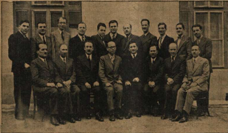
Cu ocazia institutului Casierilor ținut la București.

„Oameni promițatori în cele administrative ar trebui să se desvolte și să-și desăvârșească talentele lor prin studiul și educația cea mai temeinică. Niciunul din administratorii, cari astăzi