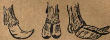
Copite rău crescute

În timpul iernii unghiile vitelor au crescut. Odată cu sosirea timpului când ele trebuie scoase afară, trebuie să le aranjăm și unghiile. Unghiile trebuie tăiate și curățate de părțile de prisos, căci acestea vor împiedeca animalul la mers. Iată aci un clișeu de unghii crescute, și un alt clișeu arătând felul cum trebuie curățate unghiile vitelor.