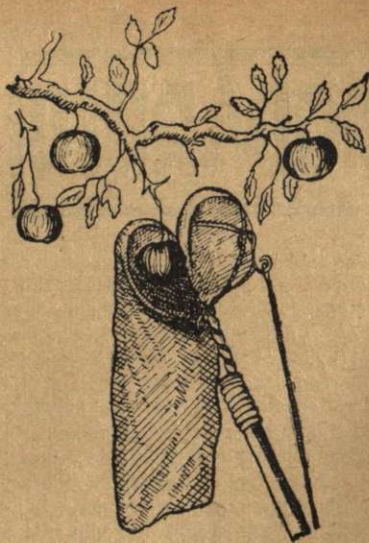
Culegător de fructe, sac cu clapă

Grădina de pomi începe cu această lună să-și dea roadele ei. In afară de fructele văratică ca: cireșile și altele, încep acum rând pe rând să ajungă la coacere fructele mai mari ca: mere, pere, prune și altele. In legătură cu acest lucru și pentru gospodarul ce tot timpul s'a îngrijit de pomii săi, vine acum grija păstrării fructelor sale sau a desfacerii ori preferențelor lor în diferite derivate. Cu privire la păstrarea merelor și perelor se recomandă rumegușul dela fierăstrăul de tăiat lemne, sau tărățe de grâu ori în lip-