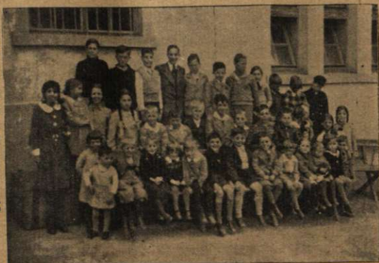
O grupă de copii ai fraților noștri, în Zurich, cu ocazia Conferinței din Aprilie 1936.