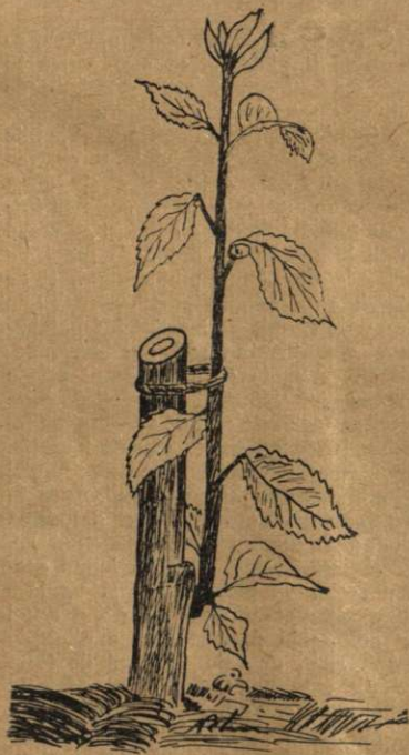
Felul de a lega

preparată din pământ galben, gunoiu și apă și plantați din nou. Pentru acei cari s'au prins avem grijă ca ramurile ce vor crește, să formeze o coroană frumoasă și folositoare, retezând pe acelea cari cresc în direcția greșită sau în așa fel încât incurcă sau strică formatul coroanei și locul liber dintre crăci. Acum e cel mai potrivit timp când ramurile cari rămân pot fi cârnite și îndreptate în direcția în care vrem, pentru obținerea coroanei dorite. Cârnitul mai ajută apoi mlădiței și pentru ca ea să se lemnifice, să se coacă, întrucât cârnirea ei va opri creșterea prea rapidă în lungime, forțând seva să ajute la îngroșarea mlădiței. Dacă va fi nevoie să cârnim o ramură, acest lucru îl vom face numai dela distanță de 3—4 ochiuri sănătoși de rădăcina ei. Dacă timpul e prea secetos, punem ceva paie la rădăcina pomilor și apoi îi udăm; paiele vor păstra umezeala necesară pomilor. În cazul acesta udarea se va face din când în când și pe cât posibil atunci când soarele nu se va mai vedea, seara. Se pot deslega altoii făcuți în luna Aprilie și Mai legându-i de un tutore (arac), pentru ca vântul să nu-i rupă. Mai jos dăm un exemplu de legarea altoilor de arac. De observat ca legătura să nu fie strânsă pentru a lipi mlădița de arac; mlădița trebuie să rămână a crește drept în sus.