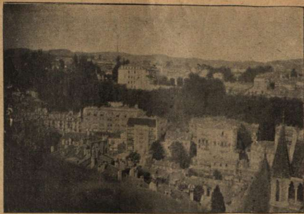
O vedere din turnul catedralei asupra frumosului oraș Lausanne.