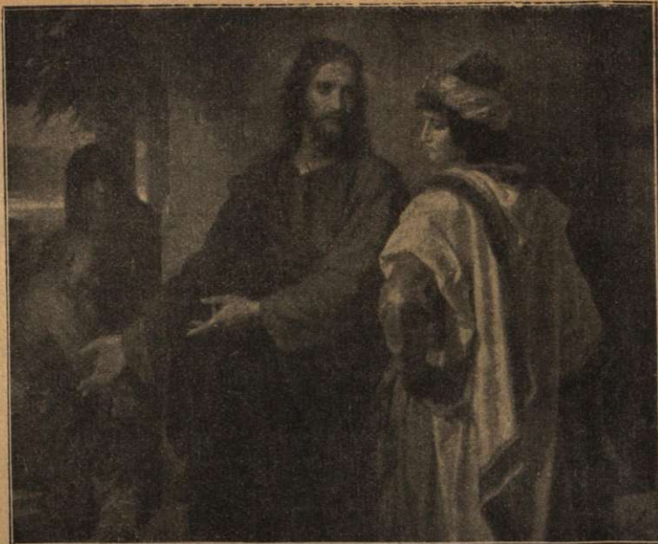
Sacrificiul cerut de Domnul tânărului bogat s'a părut acestuia prea mare și prea greu de înfăptuit.