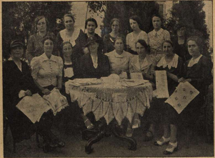
Cercul Tabita din Cluj, la o ședință de lucru, pregătind diferite lucrări prin cari să vină în ajutorul celor în nevoie din acea parte.

În România am lucrat până acum numai cu mâna stângă. Mâna dreaptă n'a fost folosită deloc. Dar noi trebuie s'o folosim acum, așa după cum ni se spune: „Există o solie cu privire la re-