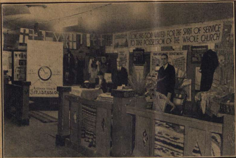
Standul Departamentului Misiunea Internă

11. Să căutăm să ținem mereu treaz în mintea membrilor faptul că lucrarea Bisericii este de a vesti solia Evangheliei, și de a câștiga suflete pentru Impărăția lui Dumnezeu. Aceasta este ținta lui Dumnezeu. Ultima mare însărcinare a Mântuitorului este dată atât Bisericii cât și predicatorului: „Duce-