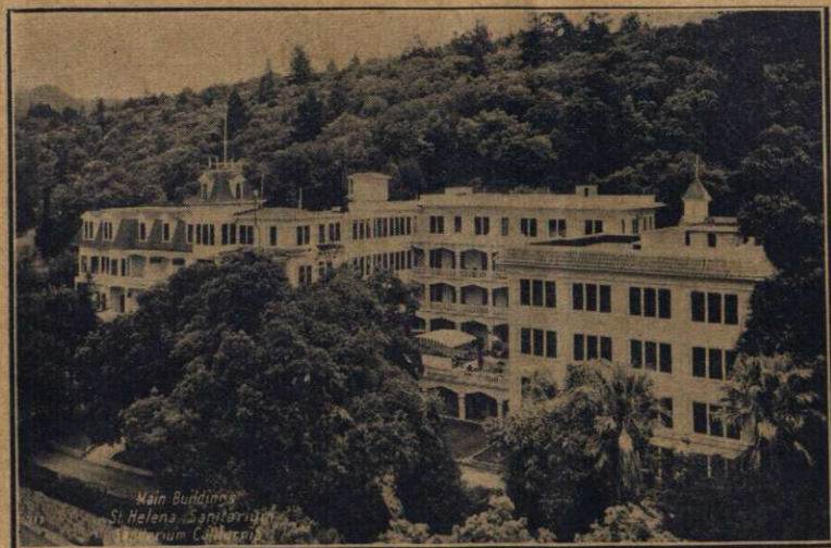
Sanatoriul Sf. Elena, California. Clădirea principală.

Noi credem că principiile de viețuire sănătoasă trebuie să fie adoptate de membrii noștri, și trăite cât mai pe deplin cu putință. Nu uităm faptul că în unele ținuturi sunt stări de sărăcie și lipsă, unde ar fi greu sau chiar imposibil pentru credincioși să-și procure măsura și felurile îndestulătoare din acele alimente cari ar fi cele mai potrivite pentru păstrarea sănătății, și de aceea nu recomandăm diete cari