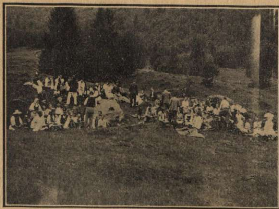
În mijlocul naturii, serbând Sabatul, iată momentul cel sublim al zilelor de tabără în munții Făgărașului.

muntelui Albota, de 1.940 metri înălțime. Timpul fiind favorabil, excursia aceasta a fost o adevărată plăcere. Deși am avut mult de urcat, totuși am uitat de orice oboseală, când, aproape de țintă, ni s'a oferit priveliștea încântătoare a Țării Oltului. Privirea ți se pierdea în zărilor albastre. Contemplând acest tablou fermecător, sufletul sorbea cu neașteptate plăcere aerul cel curat de munte. Se adevăreau cuvintele poetului din vechime, care exclamă plin de admirație: