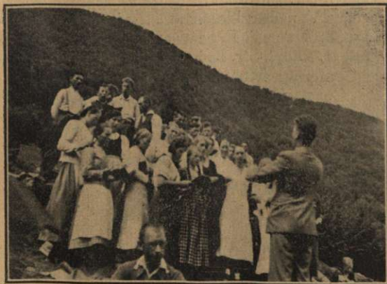
Corul și el la datorie înălțând imnuri Creatorului și aducând în inimi o înviorare divină.

După ce am luat gustarea de dimineață ne-am pregătit pentru prima noastră excursiune, adică pentru a urca vârful