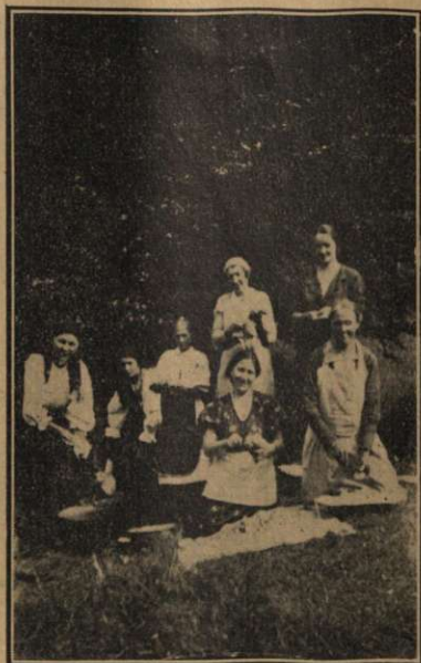
Gospodinele neobosite pregăteau cu multă îndemănare hrana cea gustoasă în fiecare zi.

Deoarece drumul este destul de lung și primele umbre ale serii se lasă peste păduri, întrebăm mereu: „Cât mai avem