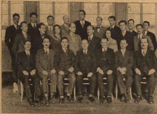
Laolaltă, toți cari au luat parte la consfătuiri.

O zi frumoasă cu caracteristicile plăcute de toamnă . . . . E sfârșit de Octombrie . . . . Soarele vrea totuși ca în răstimpul ce i-a mai rămas, să ne mai încălzească puțin . . . . Ora de plecare se apropie tot mai mult . . . . Încă un minut . . . . și apoi altul . . . . un fluierat scurt . . . . o învăluire de aburi . . . . și încet încet mașina începe să se miște, cu fiecare învățitură a roții tot mai repede și mai repede, trăgând după ea un șir înțreg de vagoane.