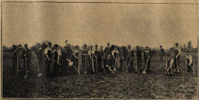
Profesorii și elevii la câmp.

Brașov. Conformându-ne dispozițiunilor ministeriale, am trebuit să clădim astfel, încât cele două