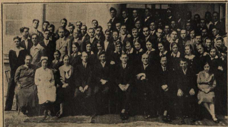
Corpul profesoral și elevii.

„Elevii acestor școli își câștigau întreținerea prin munca lor proprie, cultivând pământul, sau printr'o meserie. Lucrul acesta nu era privit în Izrail ca ceva neobișnuit sau înjositor; dimpotrivă, era socotit drept păcat a lăsa pe copii în neștiință cu privire la o lucrare folositoare... Subiectele principale de studiu în aceste școli erau Legea lui Dumnezeu, cât și instrucțiunile date lui Moise, istoria sacră, muzica sfântă și arta poetică. În rapoartele