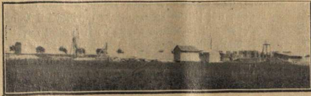
Vedere generală a lucrărilor.

onară, spre a porni în afară și a înfruntă valurile spumegânde și furtunoase ale împotrivirii, spre a vesti lumii iubirea lui Hristos, zic, pentru mine aceste două rândunele cari tot timpul au cântat, ar fi fost o încurajare ca dela Dumnezeu, că El va fi cu mine. Cred că dacă