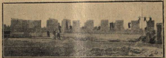
Partea din clădire deja ridicată.

Să venim și noi cu ajutorul și timpul nostru, și prin vinderea a cât mai multor ilustrații cu