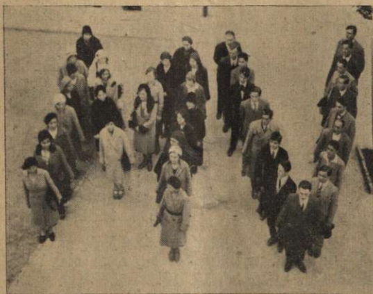
Misionarii Voluntari din București — Labirint înainte de a pleca la lucru cu Revista Festivă 1931.