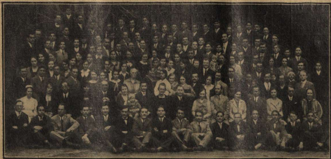
Profesorii și elevii „Institutului Biblic“, anul 1929 — 1930.

nucleu religios, orice sentiment sfânt, căci religia este adevărata bază a dezvoltării popoarelor. Stăruiește asupra necesității de a cunoaște Istoria și literatura patriei, pe cari le compară cu rădăcinile și frunzele unui pom. Mai departe zice: „Cultivați lepădarea de sine și învățați să aduceți egoismul ca sacrificiu în slujba aproapelui. Și așa, terminând școala, și ieșind în lume, vă rog respectați dreptul altuia, nu ignorați pe nimeni, ori de ce națiune ar fi, și nu judecați pe nimeni, orice credință ar avea. Dacă soarta noastră este să căutăm pe Dumnezeu, fiecare să fie liber să-L caute. Dumnezeu singur va judecă când va sosi timpul rânduit pentru aceasta“. Vorbește apoi