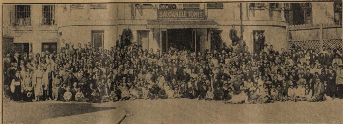
Cu ocazia Conferinței Anuale a Conferinței Muntenia-Vest.

În tot timpul Conferinței, seara au avut loc Conferințe religioase publice, cu proiecțiuni luminoase. Aceste conferințe au fost vizitate de un public numeros, care a avut ocazia să cunoască mai de aproape lucrarea de evanghelizare ce se face în țara noastră.