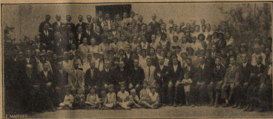
Parte din delegații din Banat-Crișana, împreună cu frații dela Diviziune și Uniune.

După facerea apelului delegaților, fr. Președinte declară deschisă Adunarea Anuală, ce-