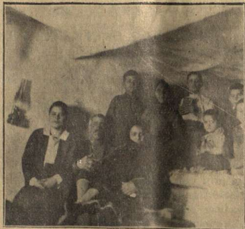
Camera în care a iernat familia Zoltanovschi.

Dimineața am strâns pe frați și am făcut o fotografie, atât cu grupa întreagă, cât și cu doi