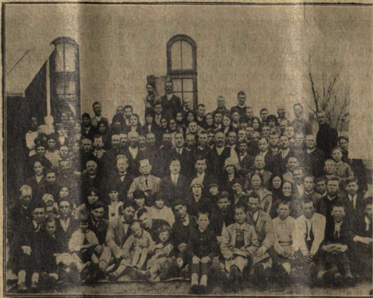
Dela adunarea slujbașilor ținută în Alexandria.