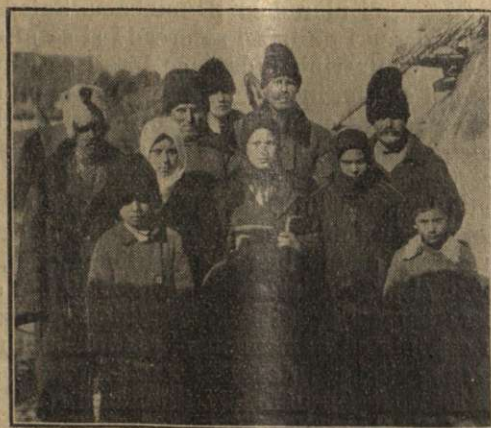
O parte din membrii comunității din Turlachi.

„Niciodată“, a fost răspunsul său, „chiar dacă nevoia ar atinge culmea ei, totuși eu nu mă voi lăsa abătut, ci sper neclintit în harul și purtarea de grijă binevoitoare a lui Dumnezeu“.