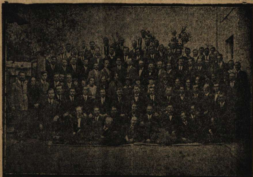
Lucrătorii și colportorii Conferințelor Muntenia și Moldova.