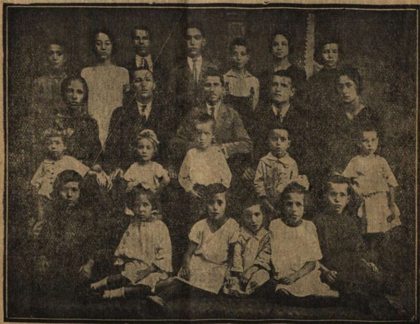
Cercul Tinerimii din Alexandria — Teleorman.

tru studiul Bibliei, cu care ocazie tineretul, atât cei pocăiți cât și cei nepocăiți să se adune pentru a se ruga și pentru a-și destăinui experiențele lor. Ar trebui să alibă șansa de a exprima ceea ce simt în inima lor. Ar fi bine ca să se aleagă la