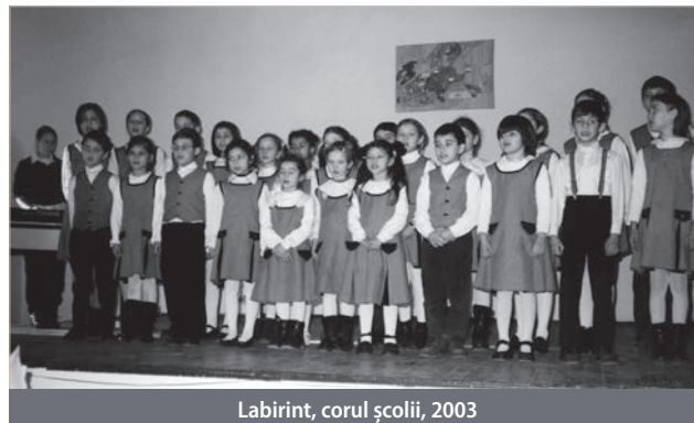
Labirint, corul școlii, 2003

Când norii apăsau atât de greu și se părea că orizontul rămâne întunecat, în decembrie 1989 a avut loc Revoluția și, cu toate că ceea ce fusese luat nu mai putea fi recuperat, inimile oamenilor s-au descătușat, se întrezăreau noi oportunități și aspirații noi au început să învieze biserica. Ceea ce mult timp exista doar în visurile și imaginația unora dintre noi, putea deveni realitate în măsura în care încrederea în Dumnezeu și dragostea pentru oameni aveau să motiveze puternic și să determine acțiuni îndrăznețe și legitime.