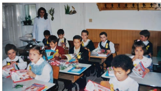
Labirint, învățători și elevi