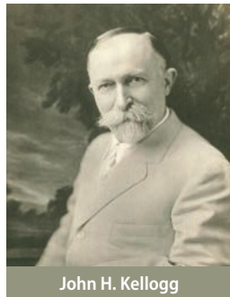
John H. Kellogg

Întrucât carta sanatoriului expira în 1897, Kellogg a făcut o manevră legală, care să-l avantajeze. Doctorul a fondat o nouă instituție, a transferat acestei instituții sanatoriul, iar membrilor noului bord, care erau de asemenea adventiști, li s-a cerut să semneze că sanatoriul va fi un stabiliment „pur umanitar și filantropic, nedenuminațional și nesectar”. Astfel, doctorul se asigura că sanatoriul (care fusese proiectul bisericii!) nu va ajunge sub controlul liderilor adventiști. 1