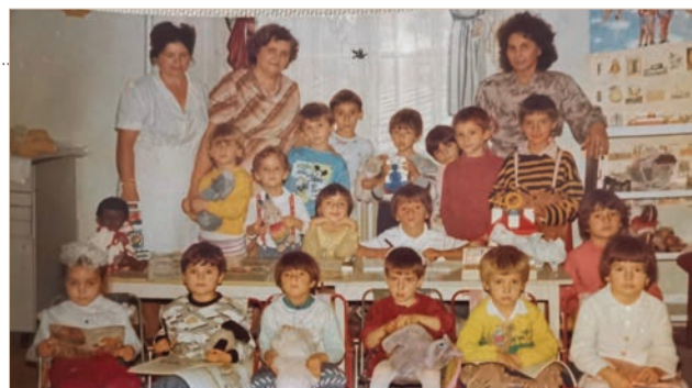
Labirint, învățători și elevi

Cu toate că anul școlar 2001-2002 a venit cu noi provocări mai ales în privința spațiului, dorința pentru