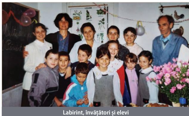
Labirint, învățători și elevi