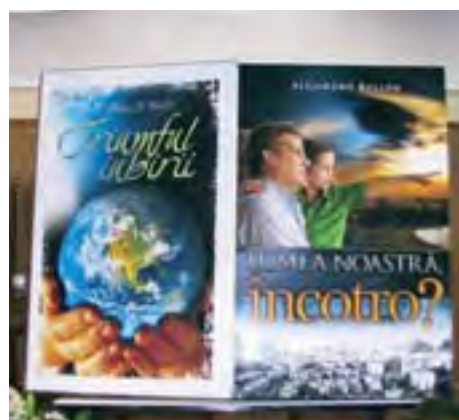
Simbolul misiunii – macheta unei cărți de dimensiuni impresionante.