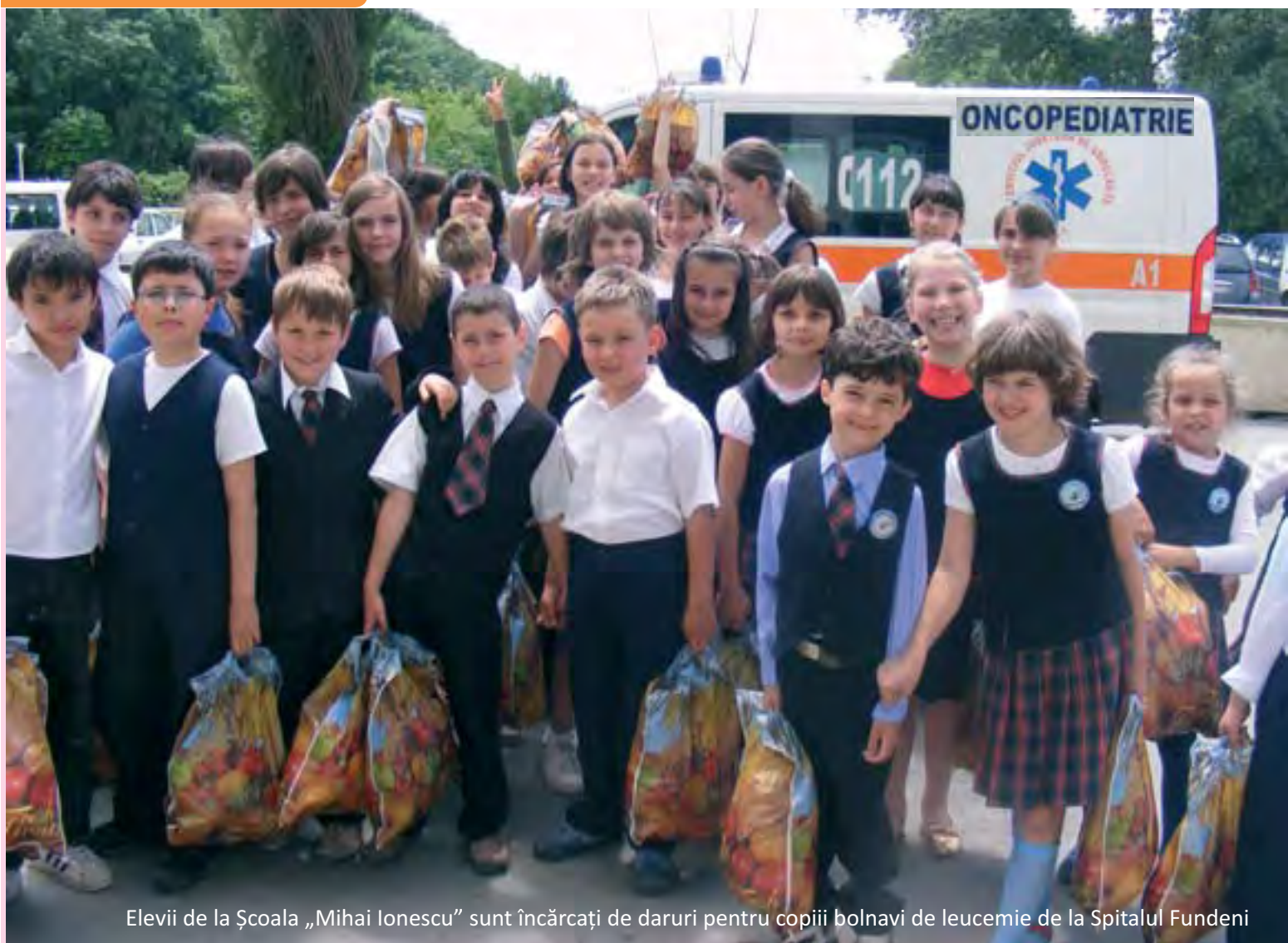
Elevii de la Școala „Mihai Ionescu” sunt încărcăți de daruri pentru copiii bolnivi de leucemie de la Spitalul Fundeni