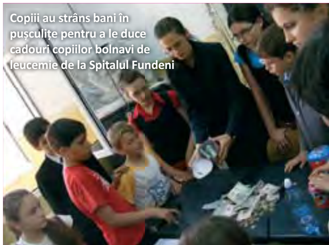
Copiii au strâns bani în pușculițe pentru a le duce cadouri copiilor bolnavi de leucemie de la Spitalul Fundeni

Ne bucurăm pentru rezultatele bune obținute la testările naționale, care confirmă faptul că și educația formală are un loc important. Așteptăm posibilitatea legală de a interveni în curriculum pentru a-l curăța de informații inutile și a-l îmbogăți cu valori pe care alte școli adventiste din lume le practică.