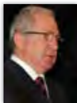
Remus Bența este președintele ASI România.

Alții sunt cei ce au nevoie de tine! Fie că administreză puțin sau mult, fie că lucrezi într-un domeniu mai important sau mai neimportant, alții au nevoie de tine. Dacă ai primit cinci talanți să-i faci zece, dacă ai primit doi să-i faci patru, dacă ai primit unul să nu stai nepăsător;