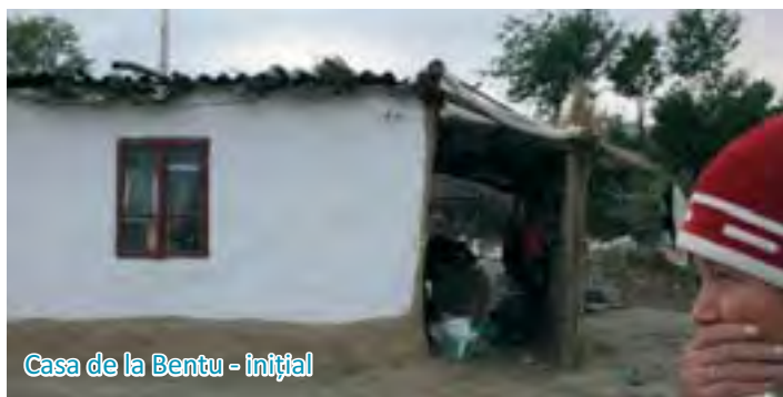
Casa de la Bentu - inițial