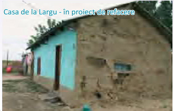
Casa de la Largu - în proiect de refacere

Curierul Adventist: În toamna anului 2008, ați încheiat cu succes o acțiune socială ce a cuprins seminare medicale și seminare educative pentru copii. Am aflat că ați construit două case și ați amenajat alte două. Cum a început totul?