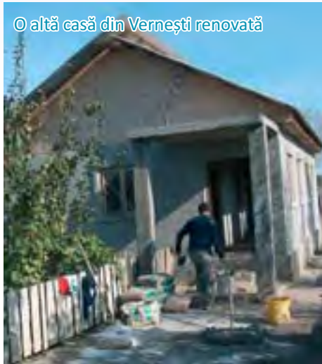
© altă casă din Vernești renovată