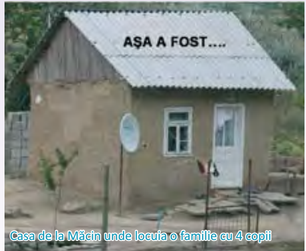
Casa de la Măcin unde locuia o familie cu 4 copii