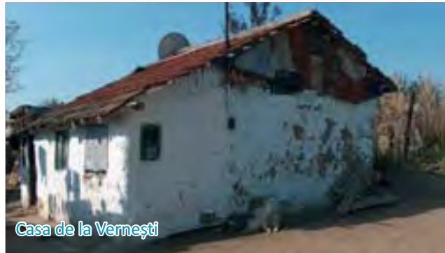
Casa de la Vernești

cu apă și casa s-ar fi dărâmat peste ei. Aici am continuat amenajările, tencuind pereții exteriori și interiori, plafonând cu rigips camerele, montând dușumeaua și zugrăvind pereții.