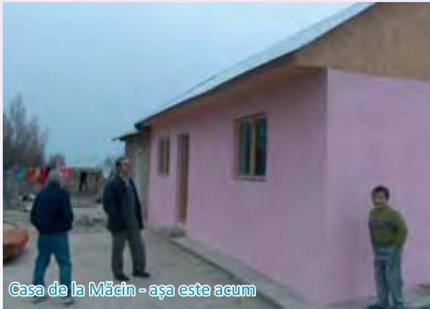
Casa de la Măcin - așa este acum