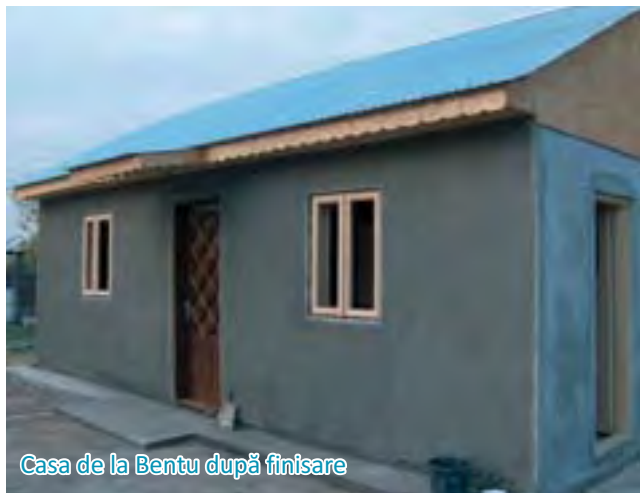
Casa de la Bentu după finisare