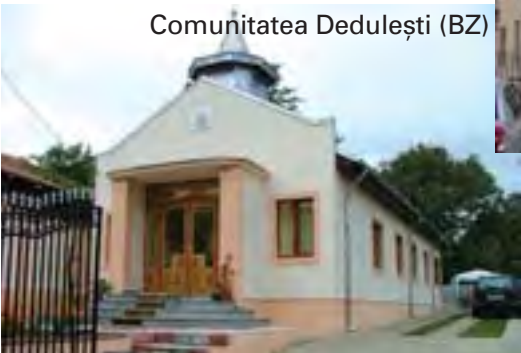
Comunitatea Dedulești (BZ)