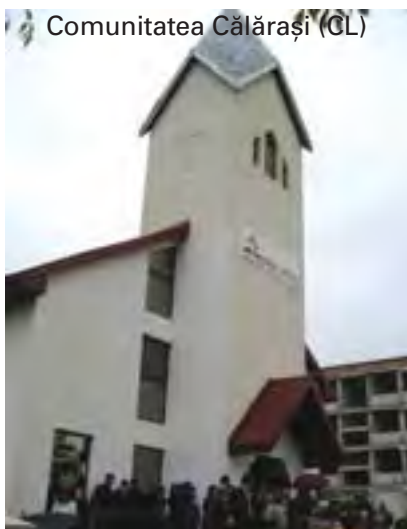
Comunitatea Călărași (GL)