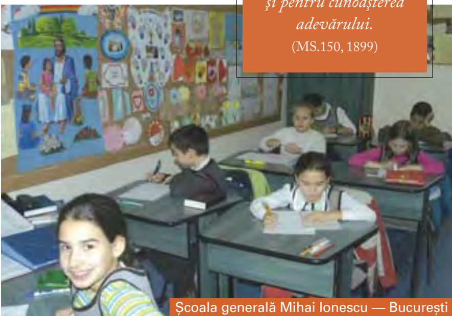
Școala generală Mihai Ionescu — București

Cu scopul acesta, pe teritoriul Conferinței Muntenia funcționează 12 grădinițe (5 în București, 2 în Ploiești, 2 în Dâmbovița, una în Buzău, una în Constanța și una în Brăila), școala Mihai Ionescu, cu clase I-VIII, Liceul Ștefan Demetrescu și Școala Teologico-Sanitară „Doctor Luca”, Brăila. Perspectiva anului în care am intrat o măsurăm deocamdată în planuri: înființarea a zece grădinițe și începerea construcției unei școli cu clasele I-VIII, la Ploiești. Împlinirea lor cere, dincolo de orice, credință în Dumnezeu care a spus că „nu ne vrea cu niciun chip rămași în urmă în lucrarea de educație”. (Idem, p. 38) ■