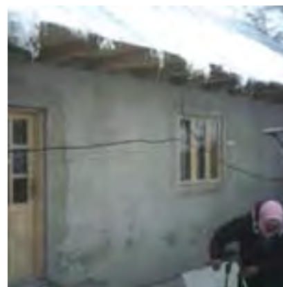
Casa familiei Stan, aproape de finalizare