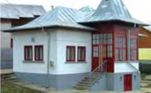
Comunitatea Drăgăneasa (PH)