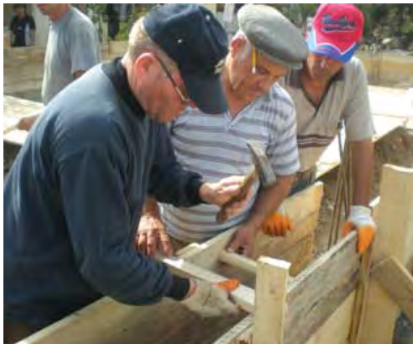
Voluntari lucrând la reconstrucția caselor