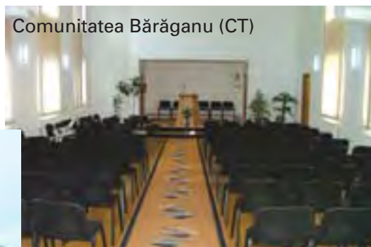
Comunitatea Bărăganu (CT)