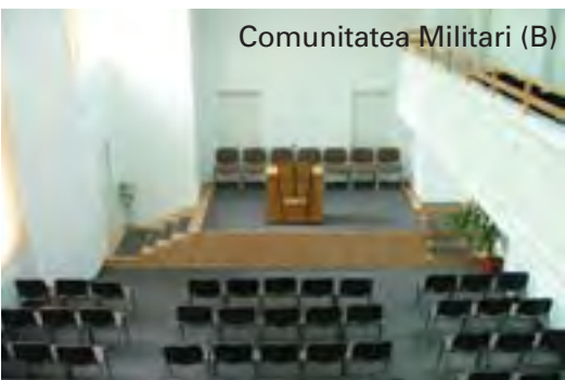
Comunitatea Militari (B)