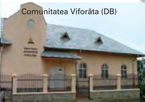
Comunitatea Viforâta (DB)