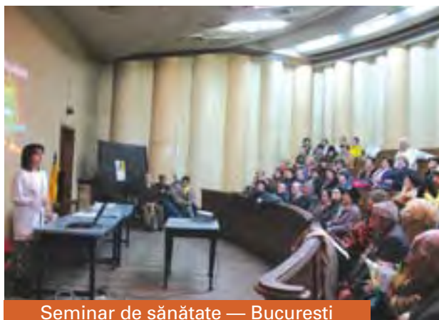
Seminar de sănătate — București

Binecuvântarea nu a întârziat să vină. Rând pe rând, am descoperit că Dumnezeu avea pregătiți oameni cu daruri de vindecare (medici și asistenți medicali), săli disponibile, gata pregătite, care așteptau parcă să prindă ecoul prezentărilor înviorătoare. Astfel, în urma expozițiilor de sănătate s-au constituit cluburi cu prezentări diverse, care au continuat să funcționeze timp îndelungat, adunând zeci și sute de oameni la Constanța, Ploiești, Buzău, Târgoviște, Câmpina, Fetești, Râmnicul Sărat, dar și în multe localități rurale. Bucuria constă