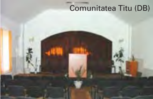
Comunitatea Titu (DB)