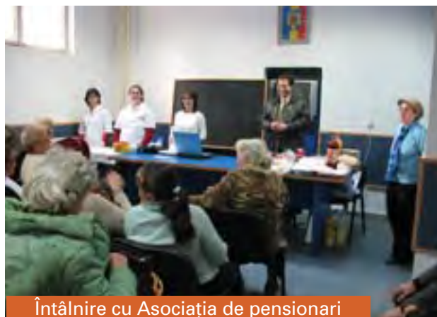
Întâlnire cu Asociația de pensionari

nu doar în prezentarea acestor seminare medicale publice (pe diverse teme: boli cardiovasculare, endocrine, pulmonare; remedii naturale, recuperare medicală, nutriție, automasaj, antistres etc.), ci și în faptul că oamenii au încredere în serviciile și în intențiile noastre și au prezentat interes și pentru seminare pe teme spirituale: „Echilibrul mintal-spiritual”, „Respirația sufletului”.