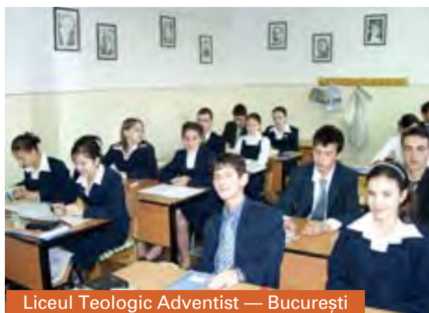
Liceul Teologic Adventist — București

extinderea luminii și pentru cunoașterea adevărului.” (MS, 150, 1899)