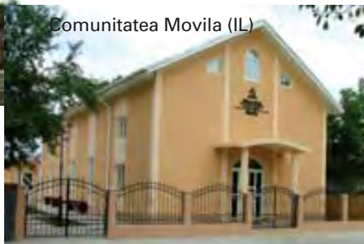
Comunitatea Movila (IL)