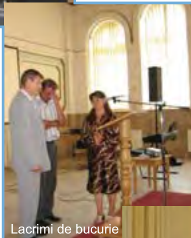
Lacrimi de bucurie

Mesajul transmis din partea lui Dumnezeu de către fr. Brito, pe tot parcursul Convenției, a chemat participanții să caute prezența Mântuitorului în viața lor, prin studiu,