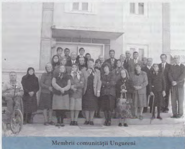
Membrii comunității Ungureni