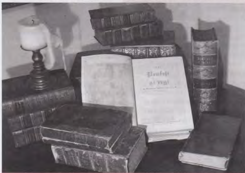
Cărțile – misionarii Domnului

Astăzi sunt tot mai puțini cei care citesc și care găsesc adevărul în Isus Hristos. Desigur, pentru cel în cauză, experiența „maramei căzute” este una fericită, dar, pentru cei din jurul lui, experiența aceasta este dureroasă. Ba chiar de neacceptat. Așa că, pentru a evita astfel de situații, încă din vechime Scriptura a fost retrasă din popor și înlocuită cu cărți despre „crede”-ul bisericii. Iar credincioșilor li se spunea că, dacă le știau pe acestea, le era suficient. Astfel, cei mulți aveau o formă de evlavie, dar fără putere.