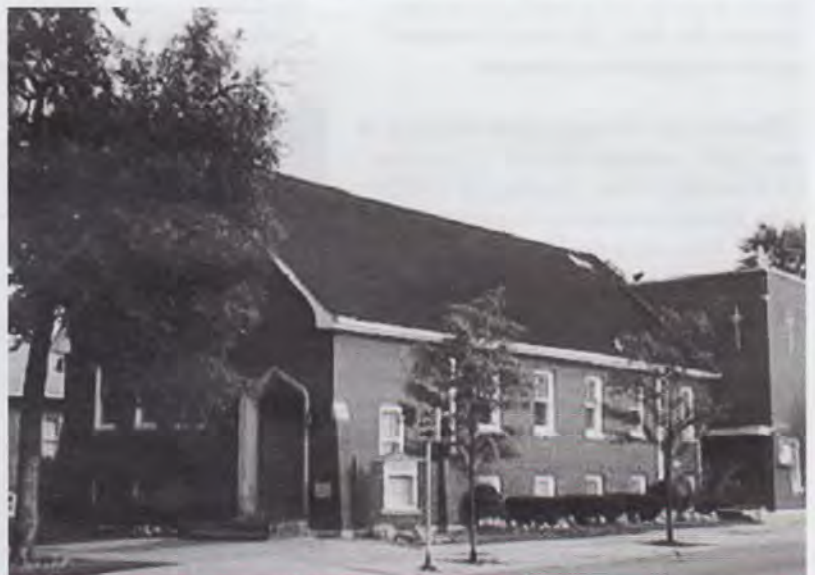
Biserica Adventistă română din Chicago

În rest, și noi aici, ca și frații noștri din România și de pe toată fața pământului, ducem aceeași luptă a credinței, atât în ceea ce privește apropierea noastră individuală de Domnul și de Cuvântul Său, cât și în ce privește maturizarea noastră colectivă, ca și comunitate frățescă, bazată pe iertare și acceptare, având ca viitor a doua venire a Domnului și Mântuitorului nostru Isus Hristos și o Împărăție care nu va avea sfârșit.