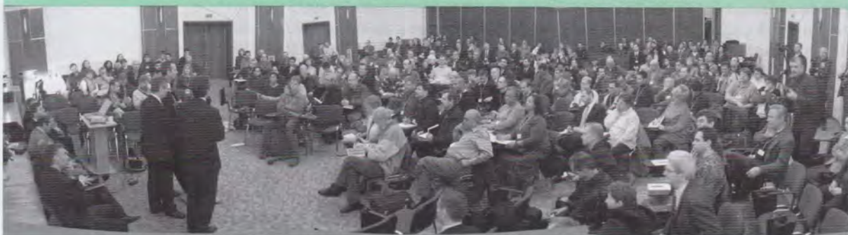
Întâlnirea de la Cernica a pastorilor și laicilor din străinătate cu gazdele lor din România

Două săptămâni, între 20 februarie și 6 martie, în fiecare seară, în 116 biserici adventiste din toată țara, oaspeții noștri vor sta în fața oamenilor doritori de a afla speranță pentru viața lor și le vor prezenta pe Mântuitorul, izvorul adevăratei speranțe. Vremea speranței , așa cum a fost denumit programul de evanghelizare al acestei ierni în Uniunea Română, ar putea fi chiar începutul unei renașterii spirituale care să trezească biserica. Faptul că, în fiecare biserică din țară, pastori și