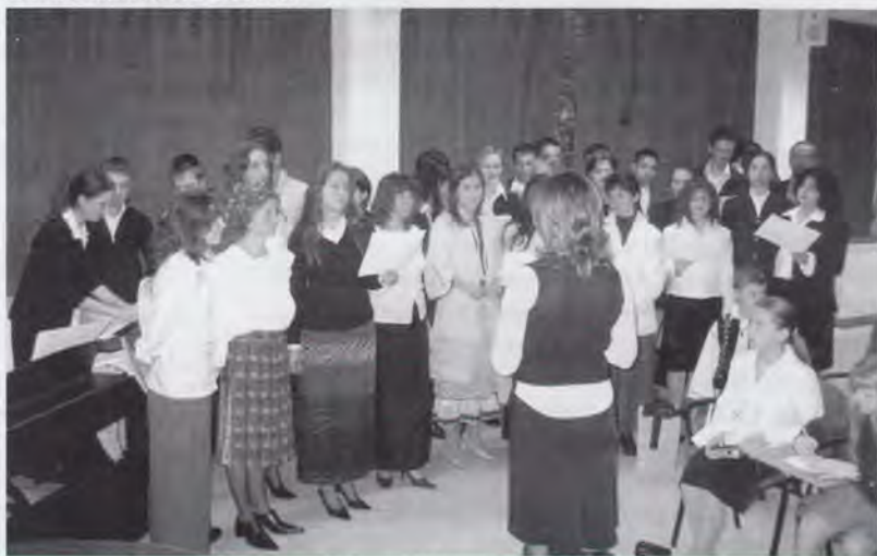
Din programul Mai aproape de casă

Dincolo de liniștea rămasă în urma acestei femei, rămâne zbulciul nostru de fiecare zi și dorința de a ajunge cât mai repede în Țara pe care o visăm de atâta vreme.