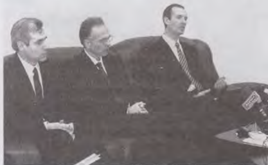
În timpul conferinței de presă

Orice eveniment public, mic sau mare, stârnește în mediile de informare reacții contradictorii și acest lucru se consideră normal. Debutul programului nostru, precum și experiențele ulterioare au atras atenția presei românești fără să stârnească însă vreo adversitate anume. Ziarele, televiziunea și alte mijloace de informare în masă s-au întrecut în a prezenta evenimentul de la Cernica în contul manifestărilor remarcabile, ce merită susținere și încurajare. Nici urmă de nemulțumiri sau înfățișări tendențioase rătăcioase, fapt atât de prezent în mass-media românească. Nu cred că acesta este rezultatul simplu și direct al unei campanii de presă bine pregătite și dirijate de cineva anume. Este mai degrabă semnul ocrotirii divine pentru că, acolo unde Dumnezeu intervine, nu se produce nici o pierdere și nici o vătămare.