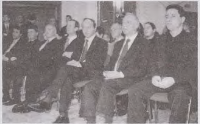
Dl Traian Băsescu, urmărind prima conferință biblică din seria „Galileanul”

Pentru cei care au urmărit știrile de joi seara, 7 martie, ravagiile făcute de furtună în șapte județe ale țării au fost dovada