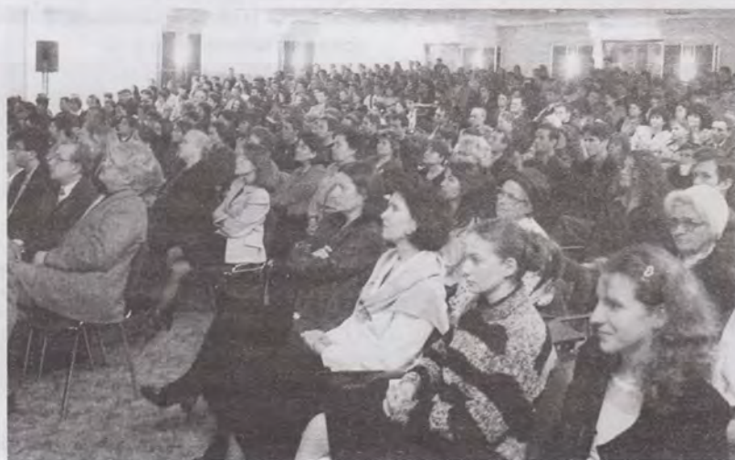
Participanți în direct la seria de conferințe „Galileanul”

La Coslada, tocmai în însorita Spanie, 100 de oaspeți se alătură în fiecare seară celor 300-400 de credincioși adunați să vizioneze GALILEANUL. Aceștia din urmă au luat toate măsurile de precauție, cum s-au priceput mai bine, așa că au avut un program foarte serios de rugăciune. Au constatat cu bucurie