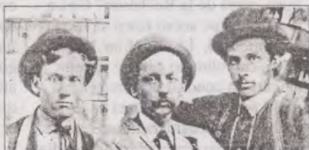
Persoane care au lucrat la „prima presă” și în redacția revistei Review , la Rochester, New York.