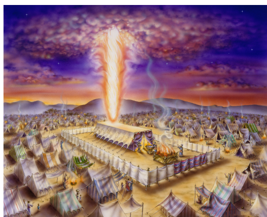
Numeri 1 – Ruben-5; Simeon-7; Iuda-6; Isahar-9; Zabulon-1; Efraim-12; Manase-11; Beniamin-2; Dan-10; Așer-3; Gad-8; Neftali-4.