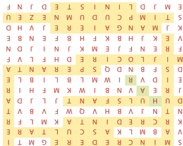
Răspuns: 1. a) mântuitor, b) prieten, c) mângâietor; 2. Vezi careul rezolvat.