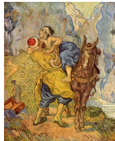
„Bunul samaritean”, tablou pictat în 1890 de Vincent van Gogh și expus la Muzeul Kröller-Müller.

Van Gogh a înțeles că omul nu are nevoie doar de predică, ci și de o mână întinsă. Cuvântul și fapta trebuie să meargă împreună. Oare câți mai gândim azi atât de departe?! Nimic nu trebuie să înlocuiască devoțiunea plină de pasiune. Oricare ar fi prețul acestui gând , el trebuie plătit. Să rămâi smerit, dar în același timp plin de sevă spirituală, ce poate fi mai frumos? Nu trebuie să permitem dificultăților teologice, socio-culturale, politice sau discrepanțelor religioase să ne distragă de la răspândirea dragostei lui Dumnezeu, arătată prin Isus Hristos, și de la autoritatea Legii lui Dumnezeu, temelia existenței. Misiunea contemporană are nevoie de o ancorare în Sfânta Scriptură și în modelul lui Isus. E nevoie de o biserică cu o pasiune întregă, care poartă o Evanghelie întregă și care se duce la lumea întregă. ■