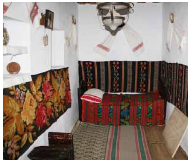
Camera de rugăciune a familiei Coșbuc

Am plecat din camera de rugăciune a poetului George Coșbuc hotărât să găsesc acest loc sacru și în casa mea, și în biserica mea. Simt că la noi se stă prea puțin de vorbă cu Dumnezeu acasă și la biserică. Aceasta se vede în sărăcia noastră de virtute și bunătate. Iar credința a ajuns ca o bijuterie: rară, ascunsă, bine păzită, ferecată și nu la îndemâna oricui. Vestirea prorociei rămâne un slogan, în timp ce Isus a zis: „Scrie prorocia și sap-o pe table, ca să se poată citi ușor!” (vers. 2). ■