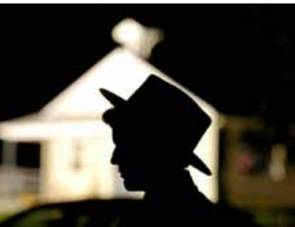
Amish fotografiat în fața școlii din Nickel Mines, unde a avut loc tragedia din 2006.

Declarația rabinului reflectă extrem de bine modul în care oamenii înțeleg să ierte. Am auzit aceeași idee în repetate rânduri, atât în societate, cât și (mai grav) în biserică. „Nu pot, nu vreau și nu trebuie să iert dacă celălalt nu mi-a cerut iertare.” Acesta este unul dintre aspectele iertării umane: așteptăm ca cel care a greșit să dea semne de căință pentru a-i putea acorda favoarea de a-l ierta.