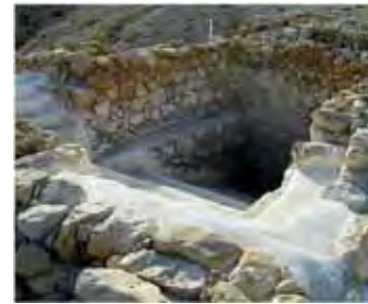
Mică amenajare specială pentru baia rituală de curățire. Domnul Hristos nu a fost de acord cu acest fel de spălare rituală și nu l-a practicat.

Manuscrisele de la Marea Moartă au demonstrat încă o dată că cele mai mari comori nu sunt cele formate din aur, argint sau diamante, ci cărțile, mai ales cele sfinte. A cumpăra o carte și a o citi este un gest nobil, care te înalță. A te opri asupra Bibliei pentru a o studia zilnic este un privilegiu care te îmbogățește. Fii evlavios și ia seama bine la citire, spunea Pavel. Aceasta te va ajuta cel mai mult în viață și te va conduce pe drumul veșniciei. Așa să-ți ajute Dumnezeu să trăiești! ■