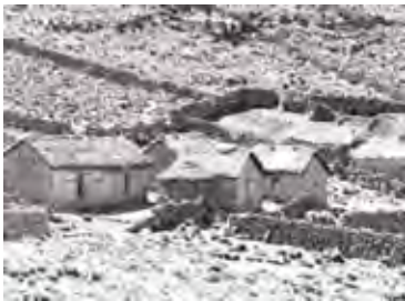
Casa lui Lino Chaiña, situată la altitudinea de 4 570 de metri