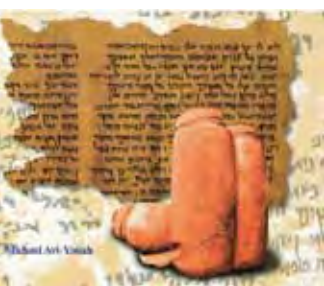
Manuscris și vase de păstrare în care au fost puse sulurile înainte de a fi ascunse în peșteri

Manuscrisele de la Qumran reprezintă dovada incontestabilă că Dumnezeu a coordonat scrierea și păstrarea Sfintei Scripturi.