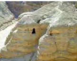
Peștera nr. 4