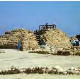
Turnul de pază al complexului de la Qumran (ceea ce a mai rămas din el)