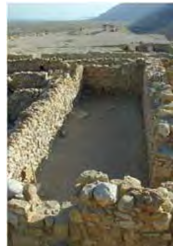
Sala unde se multiplicau sulurile biblice, numită scriptoriu; are circa 4x10 m; avea și un etaj.