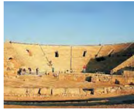
Teatrul din Cezareea – 5 000 de locuri

Nimic nu se pierde și nu se uită. „Atunci și cei ce se tem de Domnul au vorbit adesea unul cu altul; Domnul a luat aminte la lucrul acesta și a ascultat; și o carte de aducere aminte a fost scrisă înaintea Lui” (Maleahi 3:16). Nu uitați: tot ce facem, bine sau rău, se înregistrează! Numele noastre sunt săpate adânc pe hardurile cerului, consemnând atât faptele bune, cât și pe cele rele. Într-o zi, ne vom întâlni cu ele, le vom vedea în sala de judecată a Sanctuarului ceresc. Inscripția lui Pilat, din Cezareea, ne amintește acest aspect. O vizită prin vechile cetăți biblice ne ajută să fim mai atenți cu ceea ce spunem și facem. ■