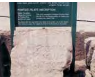
Inscripție pe piatră a lui Pilat din Pont

Ruinele vechii cetăți confirmă autenticitatea Sfintei Scripturi.