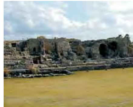
Clădirile principale din zona portului